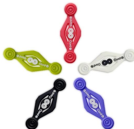
カラーバリエーション